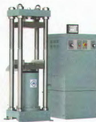
Рисунок 2 - Общий вид машины испытательной ИП4-1