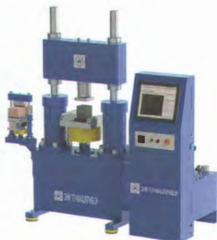
Рисунок 5 - Общий вид машины испытательной ИП2-1000/20-1М