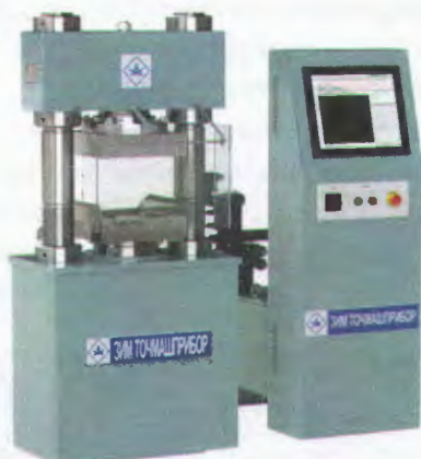
Рисунок 3 - Общий вид машины испытательной ИП-1М