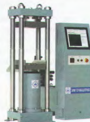
Рисунок 4 - Общий вид машины испытательной ИП4-1М