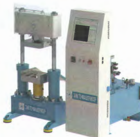
Рисунок 6 - Общий вид машины испытательной ИП2-1М