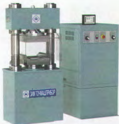
Рисунок 1 - Общий вид машины испытательной ИП-1

Внешний вид машин показан на рисунках с 1 по 7.